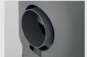
Emplacement pour raccordement d'air extérieur buse à commander en sus