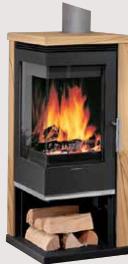
Corner, acier noir, dessus et côtés pierre sable