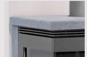
Dessus pierre ollaire