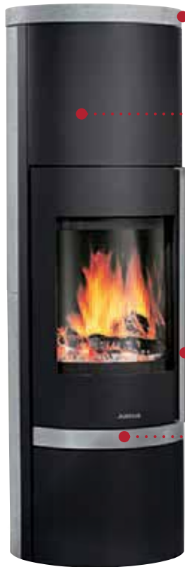
Faro W+ , acier gris, dessus et côtés pierre ollaire