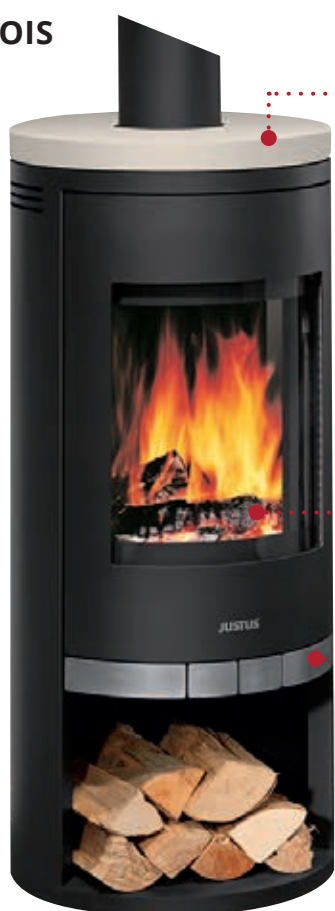
Faro, acier noir, dessus pierre cream