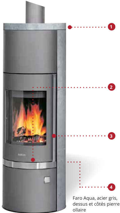
Faro Aqua, acier gris, dessus et côtés pierre ollaire